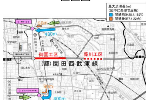
園田西武庫線 御園工区