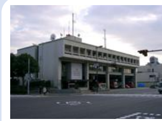
① 西消防署・消防局