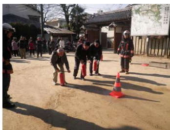
【消火器の使い方の指導】