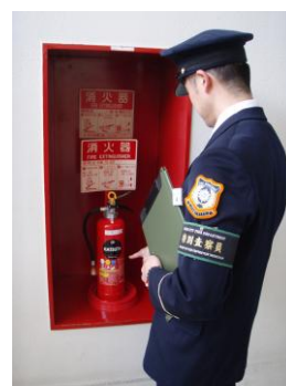
【建物や設備の検査】