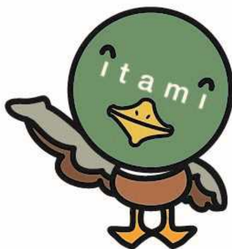
伊丹市マスコット たみまる