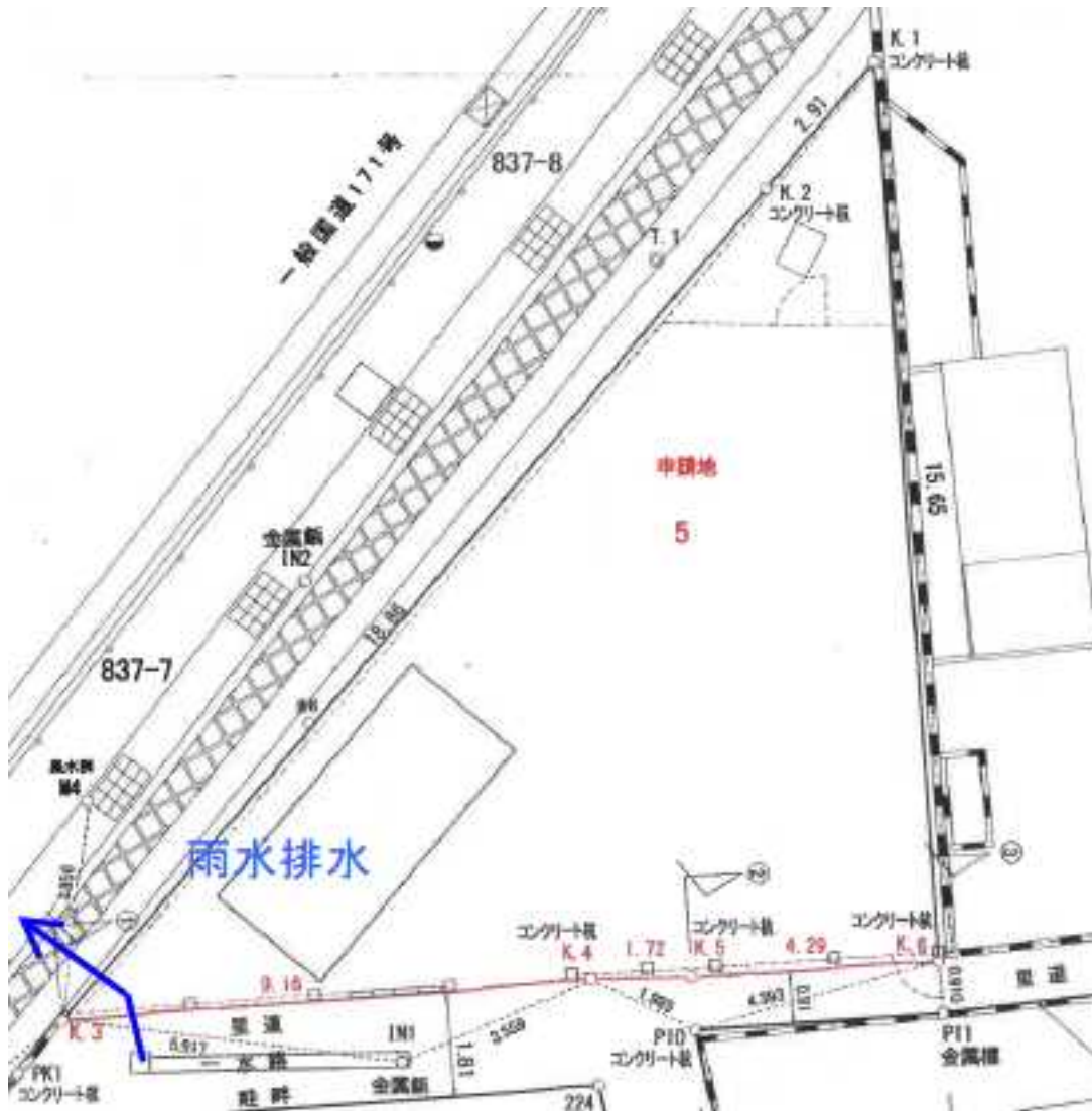
<高台4丁目 雨水排水概略図>