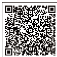
よくある質問・お知らせページ