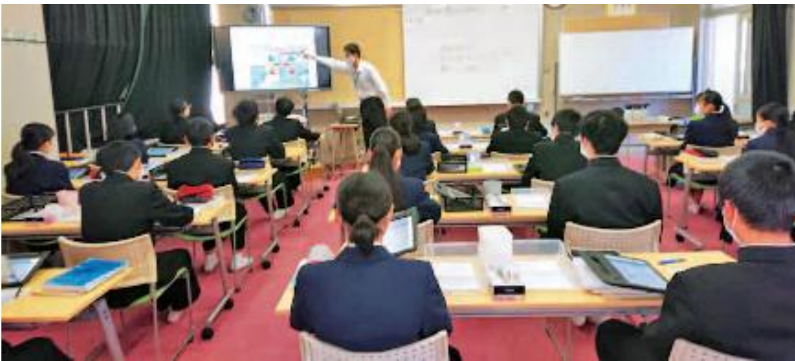
伊丹市立天王寺川中学校 2年生数学科の授業の様子 (1月15日 (金))

いま、子どもたちは様々な学習活動でタブレット端末を使っています。小学校低学年では、電源の入れ方、ログインの仕方など基本的な操作から練習しました。一人でログインができ、教師から送信された学習プリントを受け取れた時には「わあ」と歓声が上がり、教師が指示しなくても自ら、学習プリントに取り組み姿が見られました。