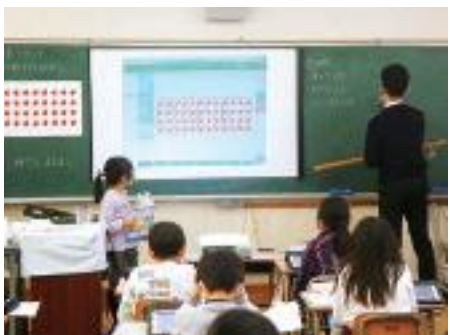
伊丹市立緑丘小学校 2年生算数科の授業の様子 (12月15日 (火))

小学校低学年では、電源の入れ方、ログインの仕方など基本的な操作から練習しました。一人でログインができ、教師から送信された学習プリントを受け取れた時には「わあ」と歓声が上がり、教師が指示しなくても自ら、学習プリントに取り組み姿が見られました。