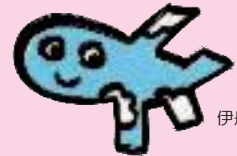
伊丹市マスコット ヒコまる

教育情報誌「すくすくぐんぐん伊丹っ子」 教育広報紙「教育いたみ」は市のホームページにも掲載しています！