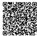
大件垃圾(收费)一览表