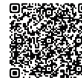
电视机等的丢弃方法