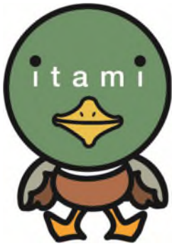
伊丹市マスコット たみまる