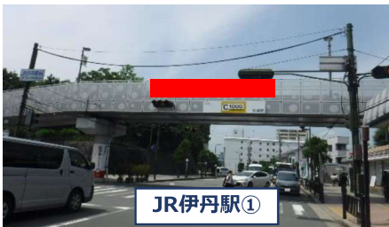
C1000歩道橋(JR伊丹駅東西連絡橋)