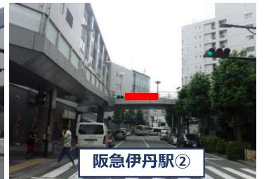
阪急伊丹駅前歩道橋(西側)