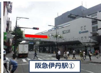
阪急電鉄 阪急伊丹駅前歩道橋(東側)