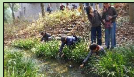
ホタルの幼虫を放流