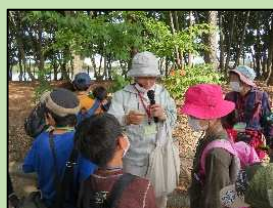
こども里山探検隊