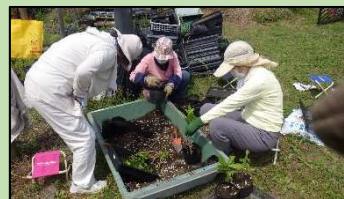
ポット上げ (昆陽南公園)