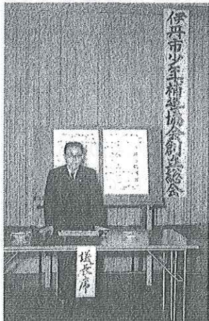
<伊丹市少年補導協会創立の様子と1万5千部配布したチラシ（昭和41年）>