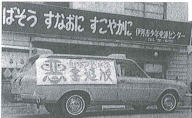
<広報車による啓発活動（昭和42年）>