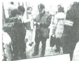
伊丹警察署員と 自転車カードを配布