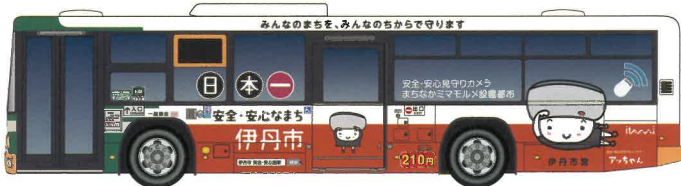
【移動受信器搭載市バス】