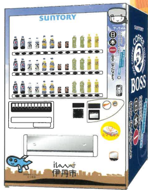
【ビーコン受信器内蔵自動販売機】