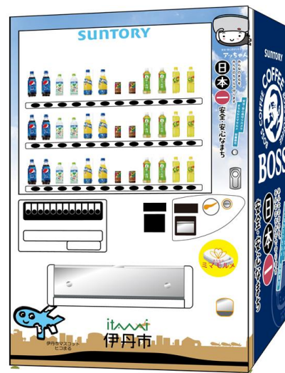
【ミマモルメ自販機イメージ】