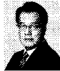
民進党代表 岡田 寛也