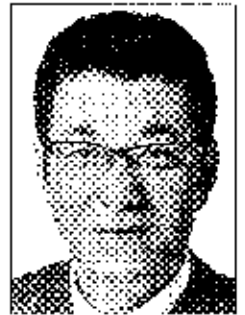
代々 松井 一郎