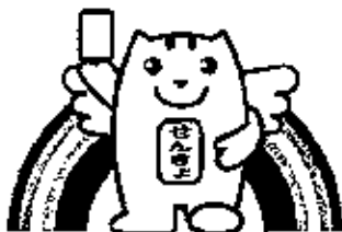
参議院議員通常選挙投票率の推移