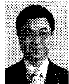
あきの 公造 現