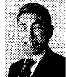
熊野 せいし 新