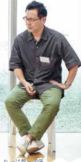
仕事は教育関係。 伊丹歴8年。