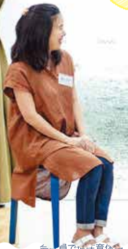
会社員で現正育休中。 伊丹歴2年。