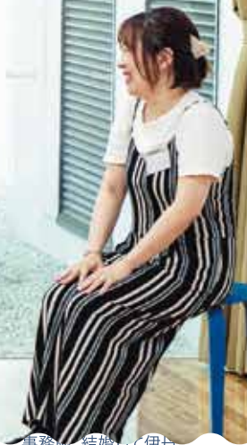
事務職。結婚して伊丹 に住み始め10年。