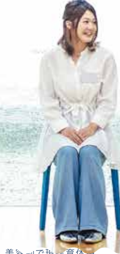
美谷副で現正育休中。 生まれも育ちも伊丹。