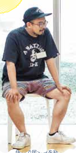
伊丹で居酒屋を経営。 伊丹歴15年。