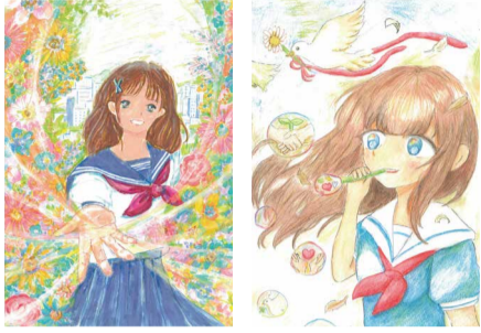
昨年の最優秀作品

りや更生への理解を深めるため、啓発イラストを募集します。入賞者には賞状・記念品を贈呈。最優秀作品は市バッシングに使用し、7月に運行 人 市内在住・在学の小・中学生 申 5月8日までに、A4サイズのカラー作品1人1点(応募要領など詳細はHPへ)を直接か郵送(必着)で地域・高年福祉課へ 問 同課Tel784-8099