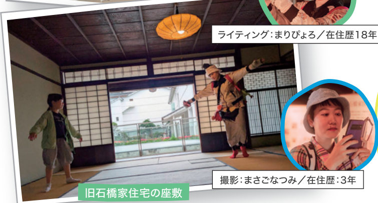
旧石橋家住宅の座敷

伊丹市昆虫館から昆陽池公園の芝生広場に続く散歩道は、自然を感じながら歩くことができ、おすすめです。広場では、ボール遊びをしたり、ピクニックを楽しんだり、寝転がって空を眺めたり。1日中自然にふれながら思いっきり遊ぶことができます。