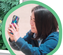
egashira / 在住歴30年以上