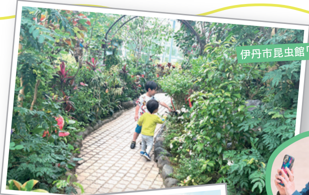
伊丹市昆虫館「チョウ温室」