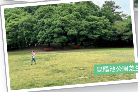
昆陽池公園芝生広場