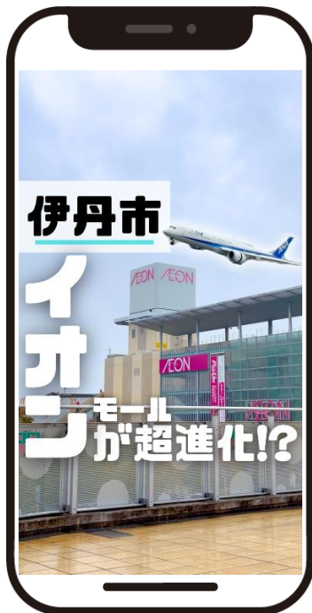
(今回作成した動画のサムネイル画像)

ヒョウゴジテンのメンバーと一緒に伊丹市の魅力とは何か改めて考えてみると、学生たちから出てきたのは「コンパクトな市なのにイオンモールが2つ」「飛行機が間近で見られる伊丹スカイパーク」「趣のある酒蔵通り」「駅前の免許センター」などさまざま。本市職員には、「学生にはそこも魅力に映っているんだ」と新しい発見もありました。