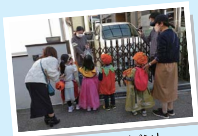
ハロウィンイベント

自治会役員になったことで、住んでいる地域のことや住民の皆さんを知ることができました。 ご近所さんがどんな人なのか交流行事などを通じて知ることができ、何かあれば互いに協力し合えるよう関係性を築いています。