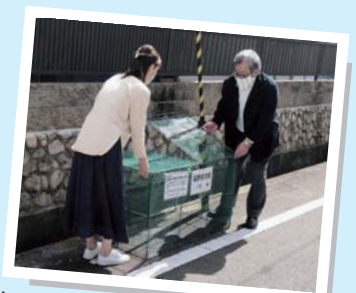
折り畳み式ごみストッカーの設置

市から提供されるごみ捨てネットなどだけでは対応できないほど、カラスによる被害が多くなったため、自治会で金属製の折り畳み式ごみストッカーを購入しました。ごみ出しの日にはカラスに荒らされて後片付けが大変でしたが、今ではきれいなごみステーションを維持できるようになりました。