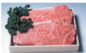
飯南町奥出雲和牛(特産品の一例)

市は、太陽光発電による電力を家庭で使用することで削減したCO 2 を取りまとめ、クレジットとして権利化する「たままる太陽光クラブ」を運営しています。同クラブへ新規入会した人全員に、本市・飯南町・阪南市の各地域特産品(6000円相当)のいずれかをプレゼント。【対象】入会申請日から過去2年以内に市内住宅で次のいずれかに該当する人▷新規で太陽光発電設備を設置▷既設の同設備に、蓄電池設備を追加設置 市役所3階のグリーン戦略室(Tel784-8054)か市ホームページ(二次元コードから読み取り可)から電子申請を。