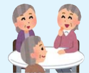
地域福祉活動への協力 地域ふれ愛福祉サロン こども食堂 など