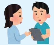
聞き取り訪問 (主に高齢者や障がい者)