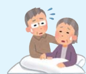
介護の不安 一人暮らしの不安