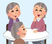
地域福祉活動への協力 地域ふれ愛福祉サロン こども食堂 など