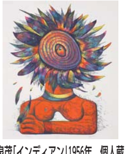
泉茂「インディアン」1956年 個人蔵

当日直接、会場へ。 同館学芸員による講座。定員80人。 【①記念講演会「季節を愛でる俳諧と茶の湯」】6月21日(金)午後2時。 冷泉為人さんによる講演。定員100人。 参加料は▽一般112千円▽小学生・高校生11千500円▽中学生以下11千円。 【②関連講座「茶の湯と季節の工夫」】6月30日(日)午後2時。 生形貴重さんによる講座。定員80人。 参加料は▽一般11千500円▽小学生・高校生11千円▽中学生以下11千円。 【③関連講座「お茶の菓子と器」】7月12日(金)午後2時。 山下昭子さんによる講座。定員80人。 参加料は▽一般11千500円▽小学生・高校生11千円▽中学生以下11千円。 【④お茶の楽しみ展】6月14日~7月28日。 現代工芸作家15人によるお茶の道具などの紹介(作品購入可)。 無料。 当日直接、会場へ。 【出品作家によるギャラリートーク】6月15日(土)午後2時。 無料。当日直接、会場へ。 【④子ども向けワークショップ「い草織りコースターをつくろう」】7月7日(日)午前10時半、午後2時。 対象・定員は、小学生以上各6人(小学3年生以下は要保護者同伴)。 参加料は千円。 ◎「泉茂 1950s 陽はまた昇る」 6月14日~7月28日。