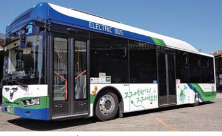
でんきバス (ELECTRIC BUS)