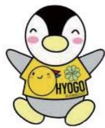
民生児童委員イメージキャラクター「ミンジー」