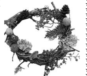
自然素材のナチュラルリース

自然の素材を使い、季節に合わせて飾り付けをアレンジして楽しめるリースを作る。対象・定員は2歳以上10人(就学前は保護者同伴)。参加料500円。 * いずれもラスタホールで。 ③随時④11月16日からラスタホールTel781・8877へ。先着順。 ★クリスマスコンサート 12月17日(日)午後1時半、神津福祉センターときめきホールで。伊丹市少年少女合唱団によるクリスマスコンサート。 定員70人。 無料。当日直接、会場へ。 神津福祉センターTel777・1022。