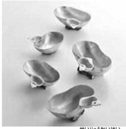
大賞：眞清乃「清珠貝盃」

11月19日～12月25日、市立伊丹ミュージアムの展示室6で、同展では入賞入選作品を一堂に紹介。作品は購入することもできます。日本酒の未来を感じる作品の数々をご覧ください。