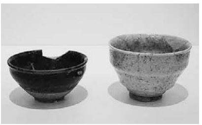
企画展「安土桃山 伊丹の陶器 村重は武将であり、茶人でもあった」の展示品

事業」を開催しています。月半ばとなりましたが、行基や有岡城に関する講演会や、御願塚古墳のフォトコンテスト、清酒発祥の地ならではの講座、毎年恒例の市内史跡一斉清掃