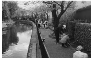
御願塚古墳での清掃活動

▷伊丹廃寺跡▷有岡城跡史跡公園▷御願塚古墳。 清掃道具持参(軍手・ゴミ袋は市が用意)。当日直接、会場へ。