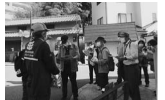
同会会員による案内

11月19日(土)午前9時～正午(荒天中止)、有岡城跡史跡公園で。 伊丹市文化財ボランティアの会会員が有岡城跡の惣構(約4km)を約1時間で案内した後、市立伊丹ミュージアムの展示「信長と戦った武将、荒木村重」を学芸員が解説。 定員15人。参加料1100円。 ☎10月17日から電話で市文化振興課文化財担当 ☎784-8090へ。先着順。