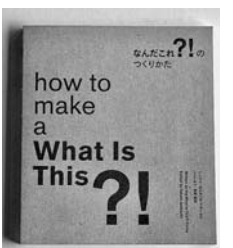
書籍「なんだこれ?!のつくりかた」

◆公民館にあれこれちよこつとパーティーするもちより☆なんだこれ?!パーティー 10月16日(日)午前10時、スワンホールで。先着順。