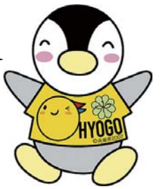
民生児童委員イメージキャラクター「ミンジー」