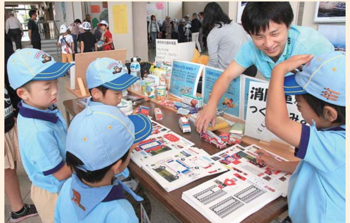
過去の同イベント