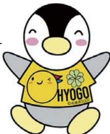
民生児童委員イメージ キャラクター「ミンジー」