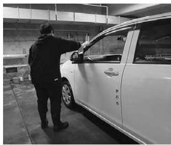
公用自動車の洗車

【返却図書の整理】▽勤務期間 8~11月、12月~来年3月の平日週2日、午後1~4時 勤務場所 図書館(こば蔵)