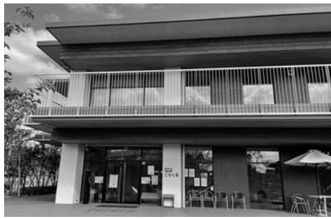
児童会館こらくる