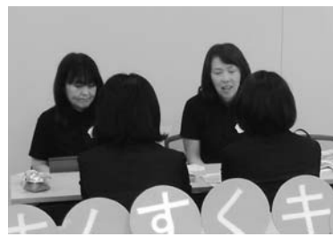
令和元年開催の同フェア

市教委は、市内で働きたい保育士や今後保育士として就職を目指す人を支援する「保育士就職フェア」を次の通り開催します。 ▽日時 9月18日(土)午後1時～4時 ▽会場 図書館「ことば蔵」地下1階の多目的室 市内の私立保育所などが就職相手を募集しています。直接、保育士に保育方針や就職についての質問・相談ができます。子どもの同伴可。 無料。当日直接、会場へ。詳しくは、市ホームページ(下二次元コード)から読み取り可。確認を。 伊丹市教委教育課 784・8035、すくすくキッズ保育園 743・9090。