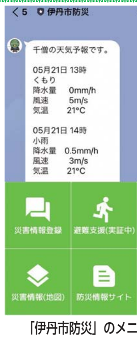
「伊丹市防災」のメニュー画面

【機能】▽被害情報収集システム 市民や職員から市内の被害状況を瞬時に収集▽避難支援II各状況に合った避難方法の情報を提供▽Lアラート連携IIアラート