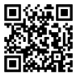
接種予約はこちら

伊丹市新型コロナワクチンコールセンター ☎764-7835 / ☎0570-783507(午前9時~午後7時半) 同コールセンターへの電話につながりにくい場合があります。 通話料は発信者の負担となります。6月1日から多言語通訳サービスを導入します。