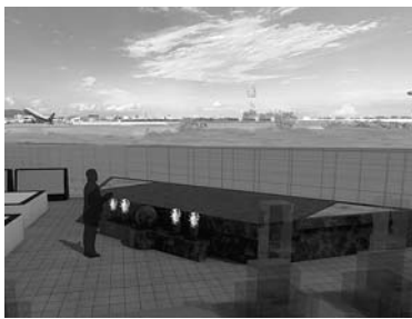
合葬式墓地 (イメージ)

市は、4月1日に合葬式墓地を神津墓地内に開設します。合葬式墓地は、最大1万体の焼骨を一つの墓に埋蔵する墓地で、共同参拝スペースや献花台、記名板を備えており、経済的負担が少ないなど多様なニーズに合わせた墓地です。対象・費用は次の通り。