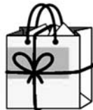
図2 雑紙回収袋以外での出し方

市は、昨年に引き続き「雑紙・雑多な紙」の分別回収を促進するため、「雑紙回収袋」を本紙9月1日号と同時に全戸配布します。「雑紙・雑多な紙」を入れ、集団回収もしくは週1回の資源物の日に出すよう心掛けましょう。問い合わせは市環境クリーンセンター ☎782-0968へ。