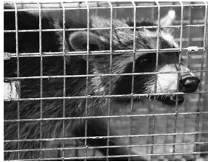
捕獲されたアライグマ

国内で外来種による被害が広がっています。外来種は、本来生息していない種が人為的に持ち込まれることで、その地域の自然安定性や人の生活が乱されるという問題があります。