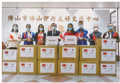
写真 3月23日、国際友好都市の中国・佛山市からマスク3万枚と防護服100着が本市へ寄贈されました。寄贈されたマスクは、医師会などを通して市内の医療機関や福祉施設・事業所などへ配布しました。