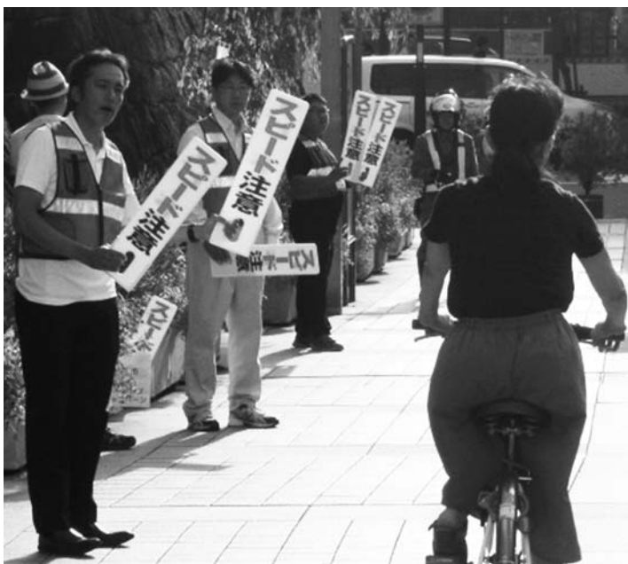
毎月実施のトラフィックカルテット作戦

昨年、本市で発生した人身事故の総件数のうち、自転車事故の割合は40%を超え(県全体25%)となっています。大半は交差点かその周辺で起こっています。昨年6月には、市内でスマートフォン操作しながら自転車を運転していた人が通学路で見守り活動をしていた人をはねて、重傷を負わせるといった重大