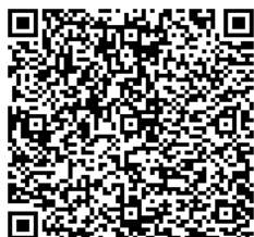
伊丹市育児メール相談