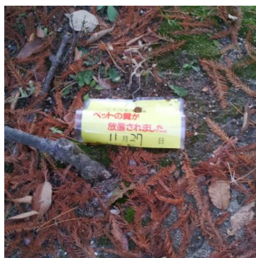
(写真: 瑞穂緑地でのイエローカード)

伊丹市でも市内の公園数箇所です平成20年から取り組んでおり、犬のフンが約10分の1に減ったという効果が出ています。