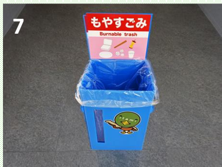
背板を取り付ける