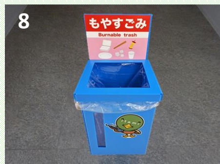
ふたを取り付けて、完成