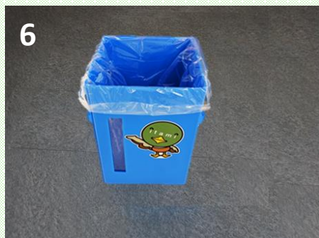
ごみ袋を取り付ける