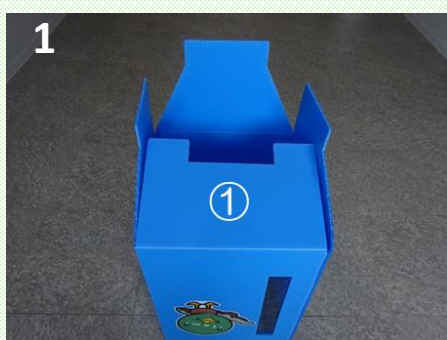
底面となる①を折る