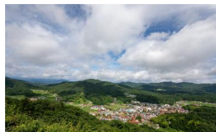
飯南町の豊かな森