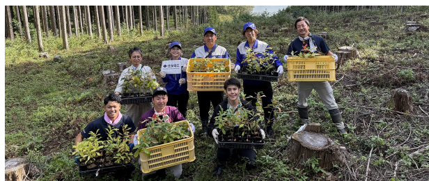
住友電工(伊丹製作所)の島根県飯南町での植林の様子

2024年度からは住友電気工業株式会社(伊丹製作所)にも苗木の育成に協力いただき、育成した苗木を2025年9月に飯南町の「姉妹都市の森」へ植林しました。