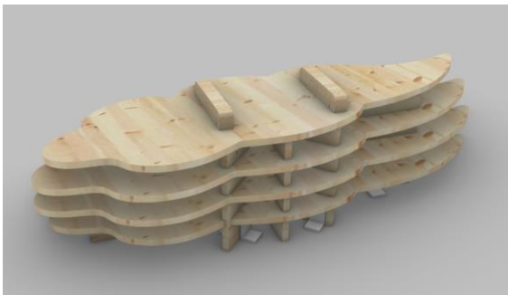
▲つながる飛行機雲ベンチ