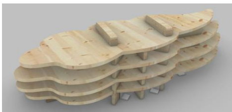
▲決定したクスノキベンチのデザイン案