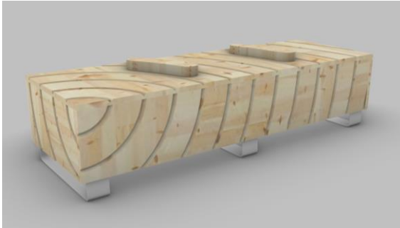
▲いたみのお酒ベンチ