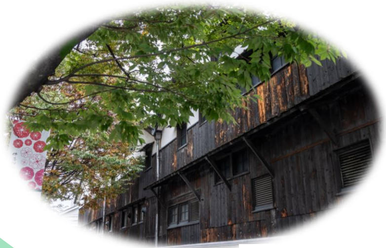
写真：小西酒造「長寿蔵」