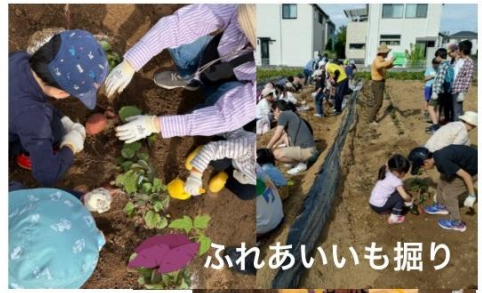
ふれあいいも掘り