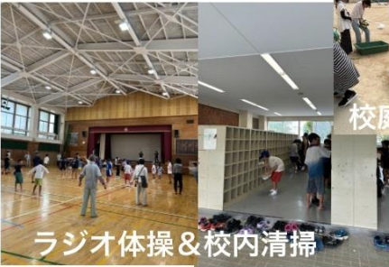
ラジオ体操 & 校内清掃