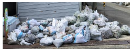
3 佐藤の町太鼓小屋前