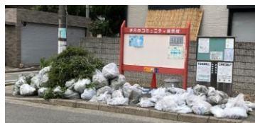
1 東の町集会所向かい

7月12日(日)、雨が心配でしたが、各ゴミ集積場に、こんなにたくさんのゴミが集まりました。