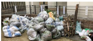
2 昆陽センター裏門