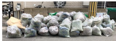
6 西田様向かい電柱前