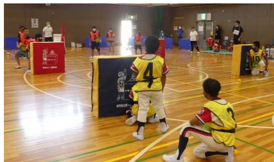
雪のない地域でも雪合戦が楽しめる「いたっボール」