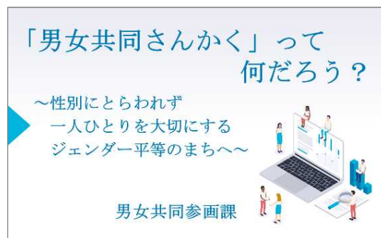
あなたの身近な男女共同参画について紹介

わかっているようで、あまりわかっていない伊丹市における「男女共同参画」について一緒に考えてみましょう。