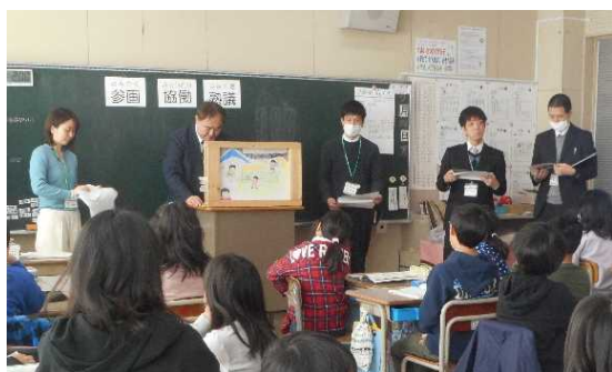
日常シーンを題材にした紙芝居で「まち条」を紹介

まちづくり基本条例の内容を分かりやすく理解してもらえるように、日常生活のさまざまな場面を題材にした紙芝居を使って説明します。