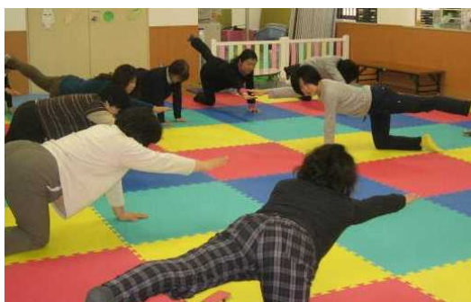
室内でできる伊丹市オリジナルエクササイズ

自宅でできる簡単な運動を伝授します。基礎代謝を増やし、燃えやすい体づくりにお役立てください。