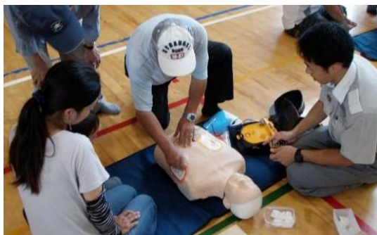
AED(自動体外式除細動器)の使い方を実践