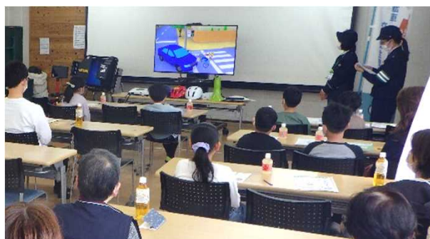
自転車に乗る際の交通ルールやマナーをレクチャー