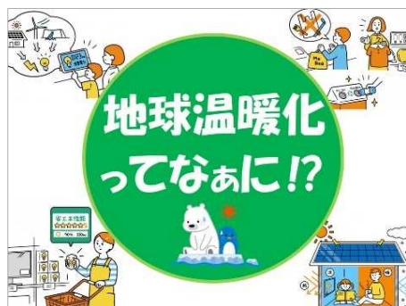
地球温暖化に対して私たちができること