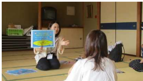
子育てサークルにてミニ講話と保育体験

乳幼児期の子育てについて、ベテラン保育者でもある幼児教育センター職員がお話します。