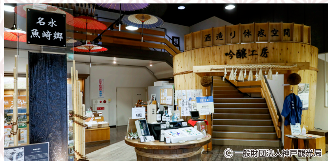
はま ふくつる ぎんじょうこうぼう

住所：〒662-0944 西宮市川添町15-26 TEL：0798-33-1298