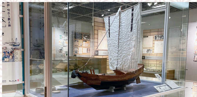
にしのみや しりつきょうど しりょうかん

住所：〒664-0851 伊丹市中央3-4-15 TEL：072-773-1111