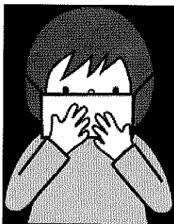
外出时请佩戴口罩!!