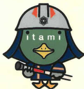
伊丹市マスコット たみまる