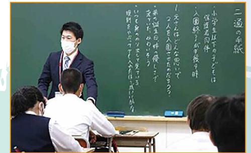
道徳科の授業(南中学校)