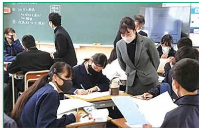
数学でのグループ学習(西中学校)

幼児教育は、生涯にわたる人格形成の基礎を培う重要な役割を担っており、各園(所)の創意工夫を生かした質の高い教育を推進します。