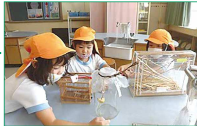
出前授業で虫の生態を教わる園児(伊丹幼稚園ありおか分園)

先行き不透明な変化の激しい時代の中で、多様な人々と協働しながら、社会的変化を乗り越え、豊かな人生を切り拓き、持続可能な社会の創り手となることができるよう、必要な資質・能力を一体的にはぐくみます。