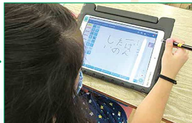
授業でのタブレットの活用(瑞穂小学校)