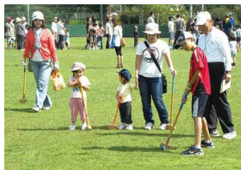
体育の日のついで(グラウンド・ゴルフ)